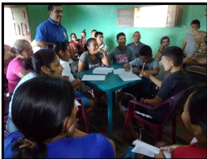
Elaboración de Plan Zonal Sector: 1 - N-E