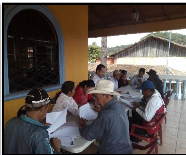
Elaboración de Plan Zonal sector: 3 Sector: 2