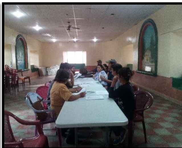
Elaboración Plan Zonal Sector: 2