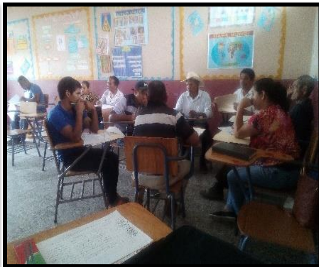
P.D.C. Chogola Centro, San Vicente N-E