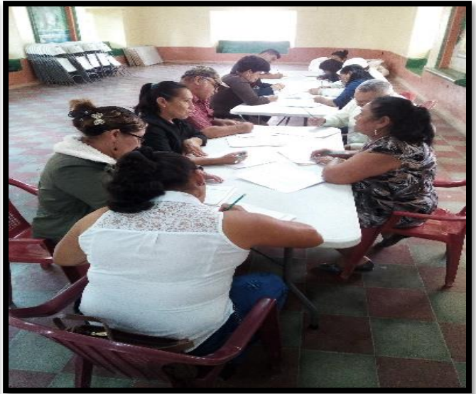
Revisión de P.E.D.M