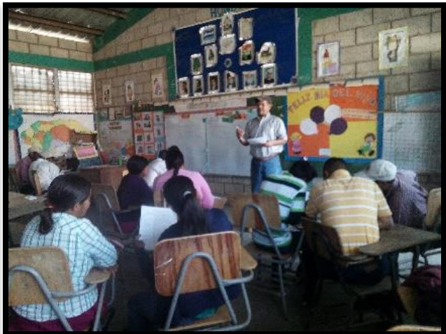
P.D.C. Lepaterique Norte, San Esteban